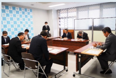
▲贈呈式後の懇談会の様子